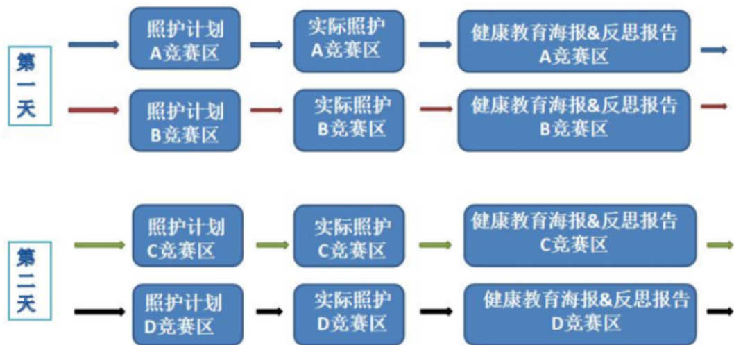
图 2 健康与社会照护赛项竞赛模块流程